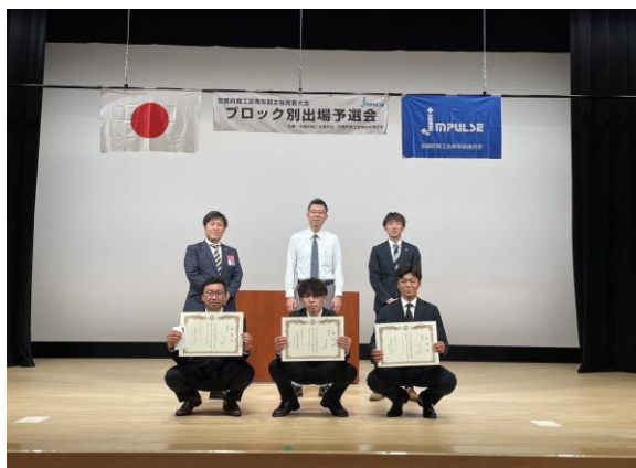
(右)全体での集合写真

惜しくも来る 8/2 (水) に開催される京都大会に進出することは叶いませんでしたが、私も現地で観戦しました。コロナ禍を経ての自分の想いを話されている姿に感激しました。