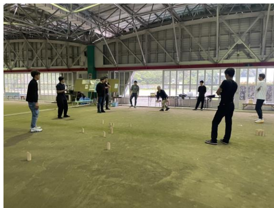
(右) モルックを楽しむ様子

身体を動かす交流会事業のあとは、青年部員が営む「キッチンあまわか@日吉町」で懇親会を行いました。懇親会を通じて、青年部同士の絆を深めていただけました。