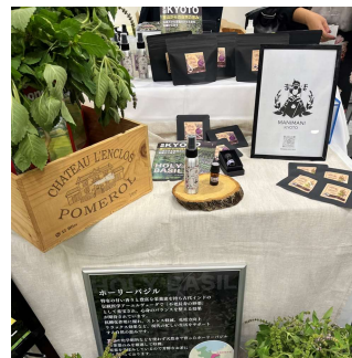
TOCCO トッコ 〒629-0141 京都府南丹市八木町八木鹿野69-4 ☎090-8753-1455 https://www.tocco-all.com/