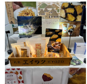
美山珈琲 ミヤマコーヒー 〒601-0722 京都府南丹市美山町安掛寺ノ下8-3 ☎070-8962-2102 https://miyamacoffee.studio.site/

会員事業者様のお声から、商工会として様々な施策を立案したいと考えております。 『こういった展示会に出たい、おこないたい』など、ご要望をぜひお聞かせください。