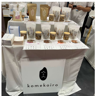
有限会社 朝日製粉所 アサヒセイフンジヨ 〒629-0141 京都府南丹市八木町八木杉ノ前40-4 ☎0771-42-2327 https://www.asahiseifun.com