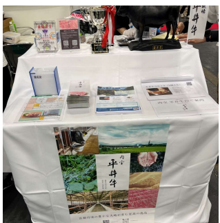
有限会社 京都丹波牧場 キョウトタンバ(ボクジヨウ) 〒629-0132 京都府南丹市八木町屋上足尾48 ☎0771-42-4748 https://hiraigu.com/