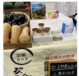
きよしファーム キヨシファーム 〒629-0141 京都府南丹市八木町白置西中里17-1 ☎090-9709-5008 https://kyoto808kiyoshi.com/