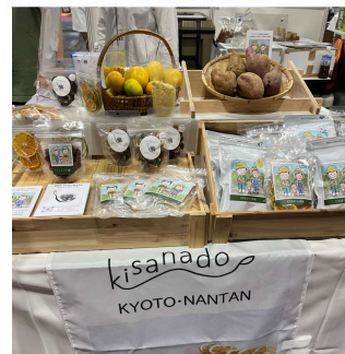
きさな堂合同会社 キサナドウ 〒629-0311 京都府南丹市日吉町胡麻藤田川11-11 ☎kisanado.llc@dryfood.kyoto https://dryfood.kyoto