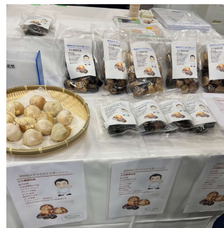
いづつか療術院 イヅツカリョウジュツイン 〒622-0025 京都府南丹市園部町曾我谷下土井19 ☎0771-63-0502 https://iizuka-web.com/