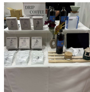
みやま堂 ミヤマドウ 〒601-0722 京都府南丹市美山町安掛寺ノ上14 ☎090-5133-7988 https://www.instagram.com/seito_no_gokubou_miyamadou/